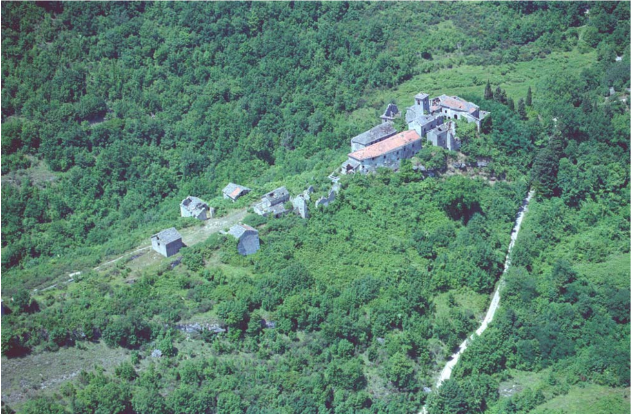
7.1 Il borgo disabitato di Castiglioncello