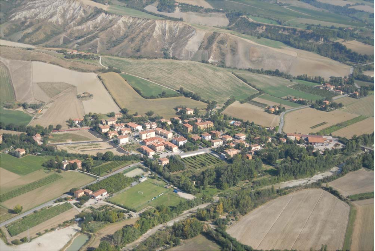
7.22 Il nucleo abitato di San Martino in Pedriolo