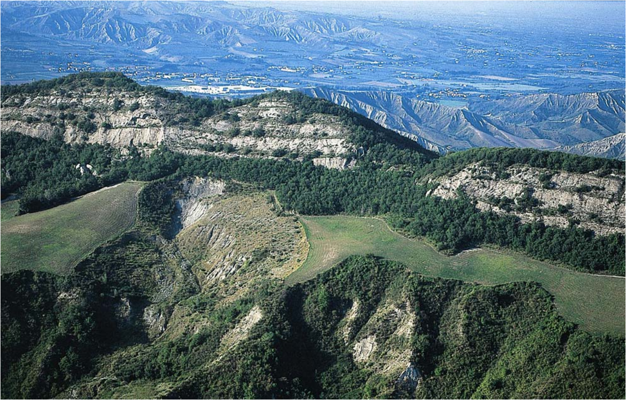
7.11 La Vena del Gesso ad Est di Borgo Tossignano, denominata Riva di S. Biagio, culminante nella cima più elevata di Monte del Casino (Da Monte Battagliola).