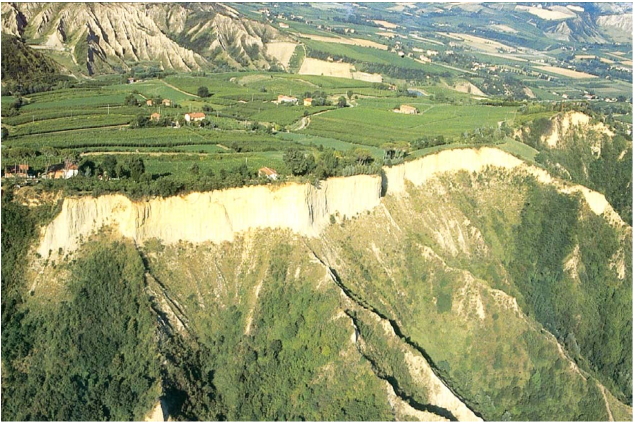
7.20 Terrazzo morfologico, intercalato alle formazioni calanchive, su cui si andata sviluppando un' agricoltura intensiva erbacea ed arborea. Località Casalino.