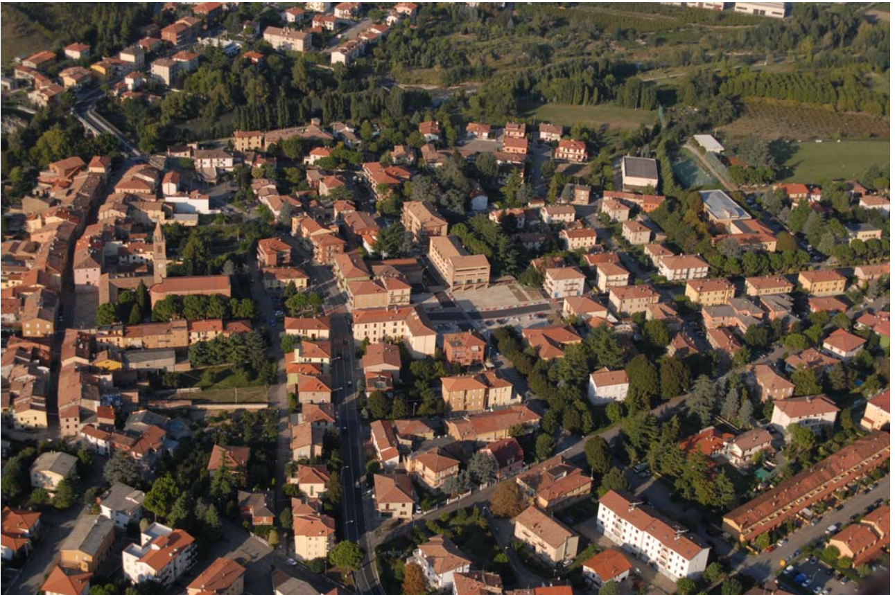
7.10 Il centro abitato di Borgo Tossignano