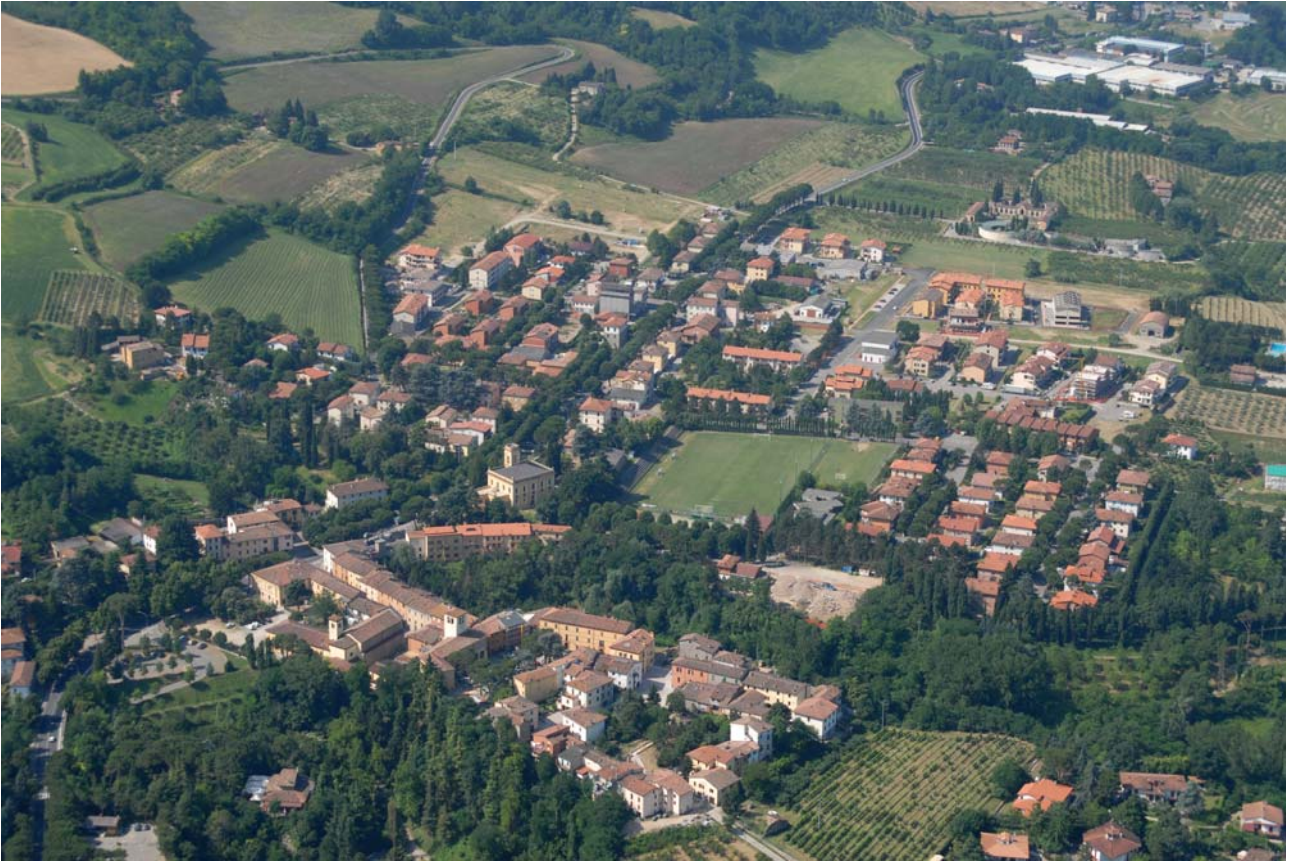
7.9 Il centro abitato di Fontanelice