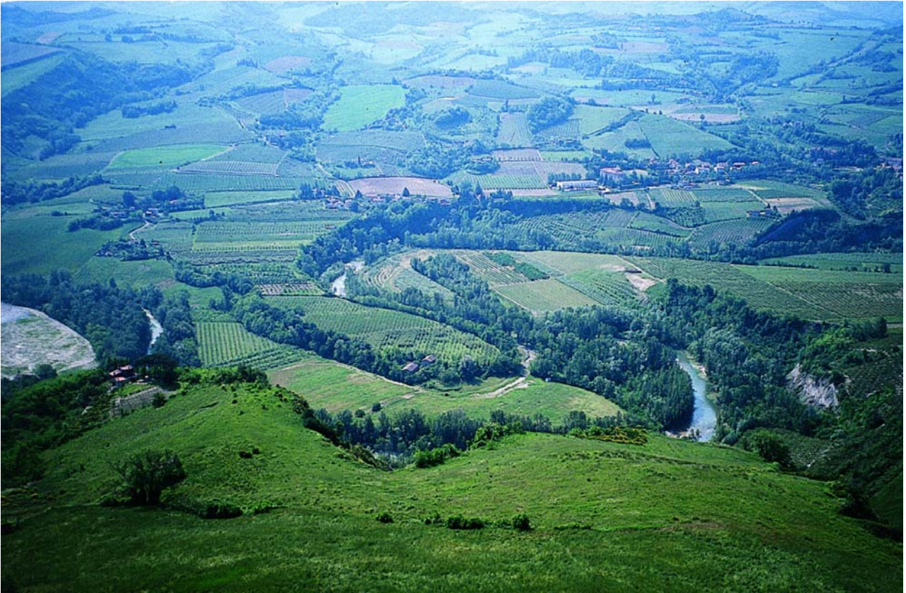
7.16 Meandro del fiume Santerno in località Campola