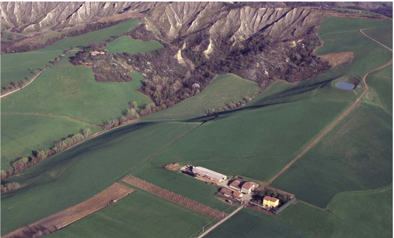
7.23 Località Farneto Nuovo in prossimità di S. Martino Pedriolo in sinistra torrente Sillaro.