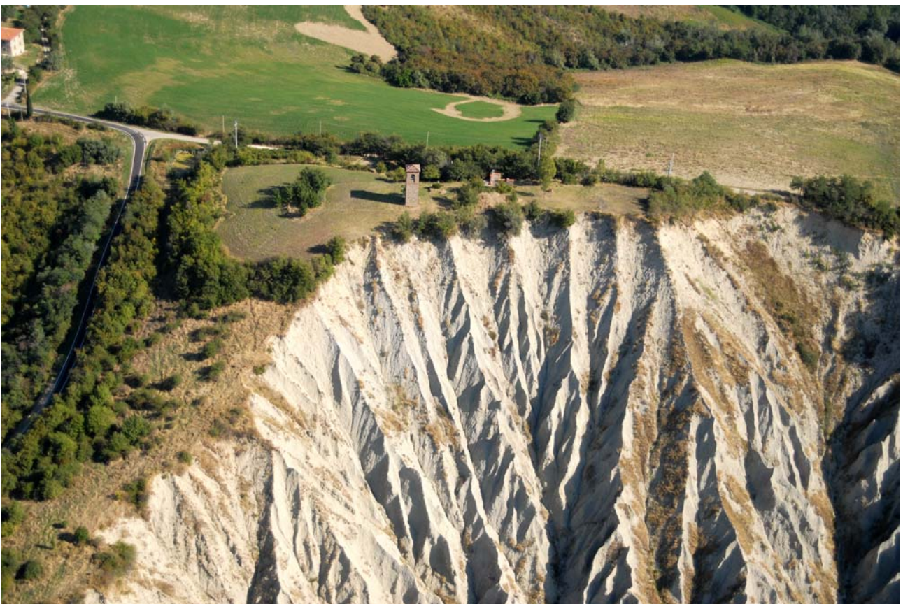
7.17 Formazione dei calanchi nelle argille azzurre plioceniche intensamente modellate ed incise dalle acque meteoriche. Al centro la torre campanaria unica superstite dell'antica chiesa di Fiagnano