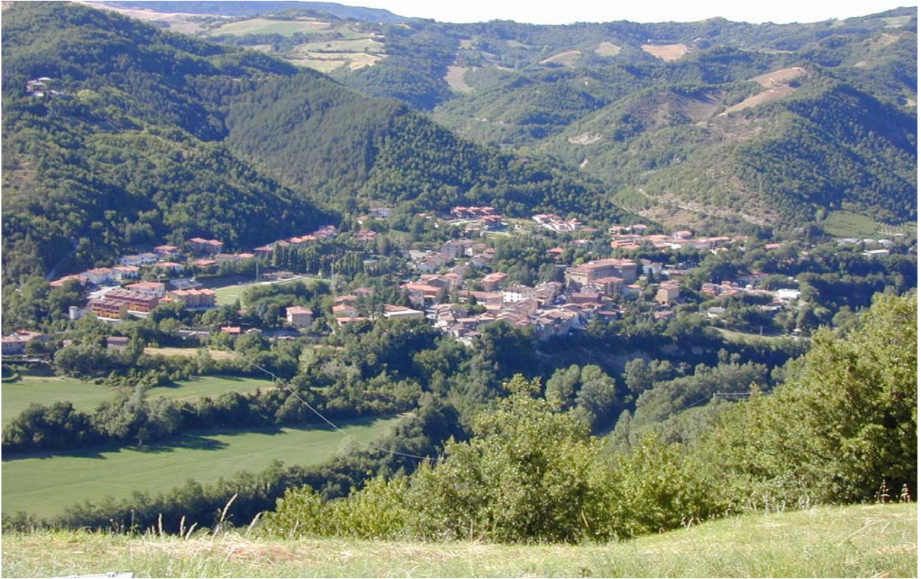
7.3 Il centro abitato di Castel del Rio