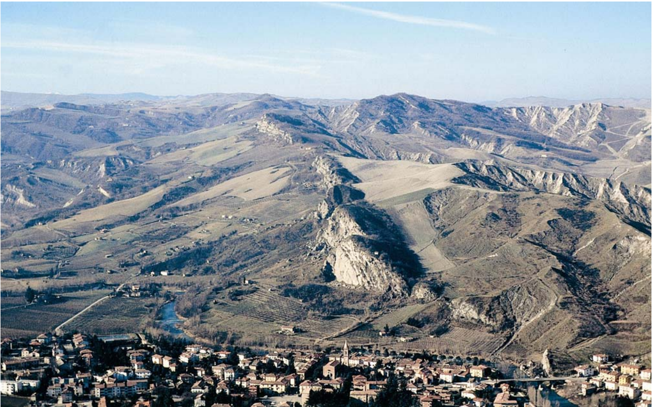
7.12 La Vena del Gesso ad ovest di Borgo Tossignano culminante nella cima più elevata del Monte Penzola ed a contatto con le formazioni plioceniche delle argille grigio azzurre (Da Tossignano).