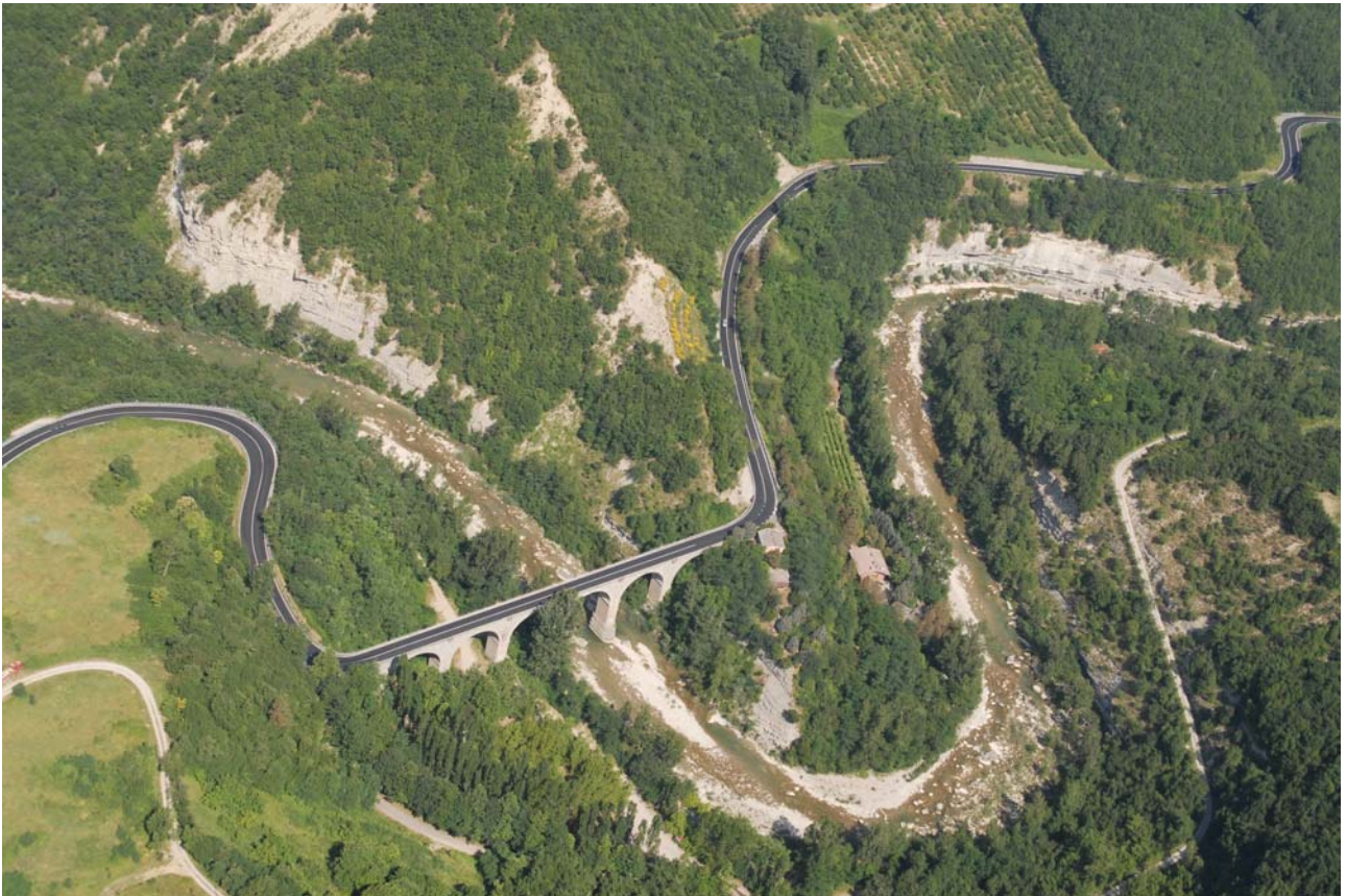
7.2 Anse del fiume Santerno in località Lido di Valsalva