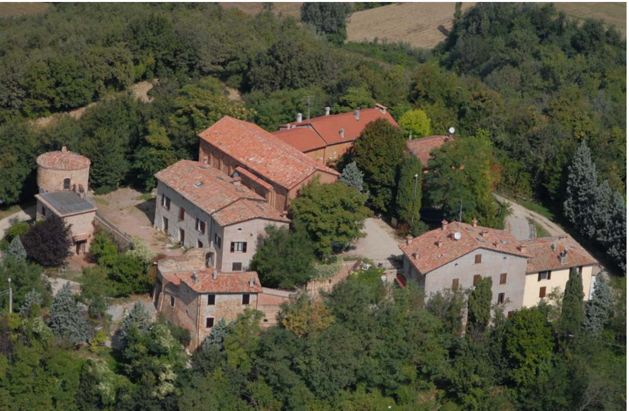
7.19 Il nucleo storico di Pieve San Andrea