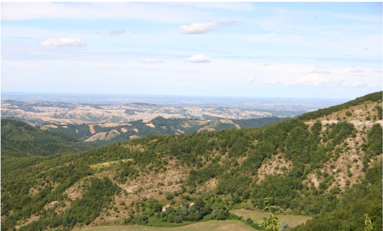
7.8 In primo piano la formazione Marnoso.Arenacea , in secondo le forme calanchive delle formazioni plioceniche e sullo sfondo la pianura padana tra i territori di Imola e Faenza.