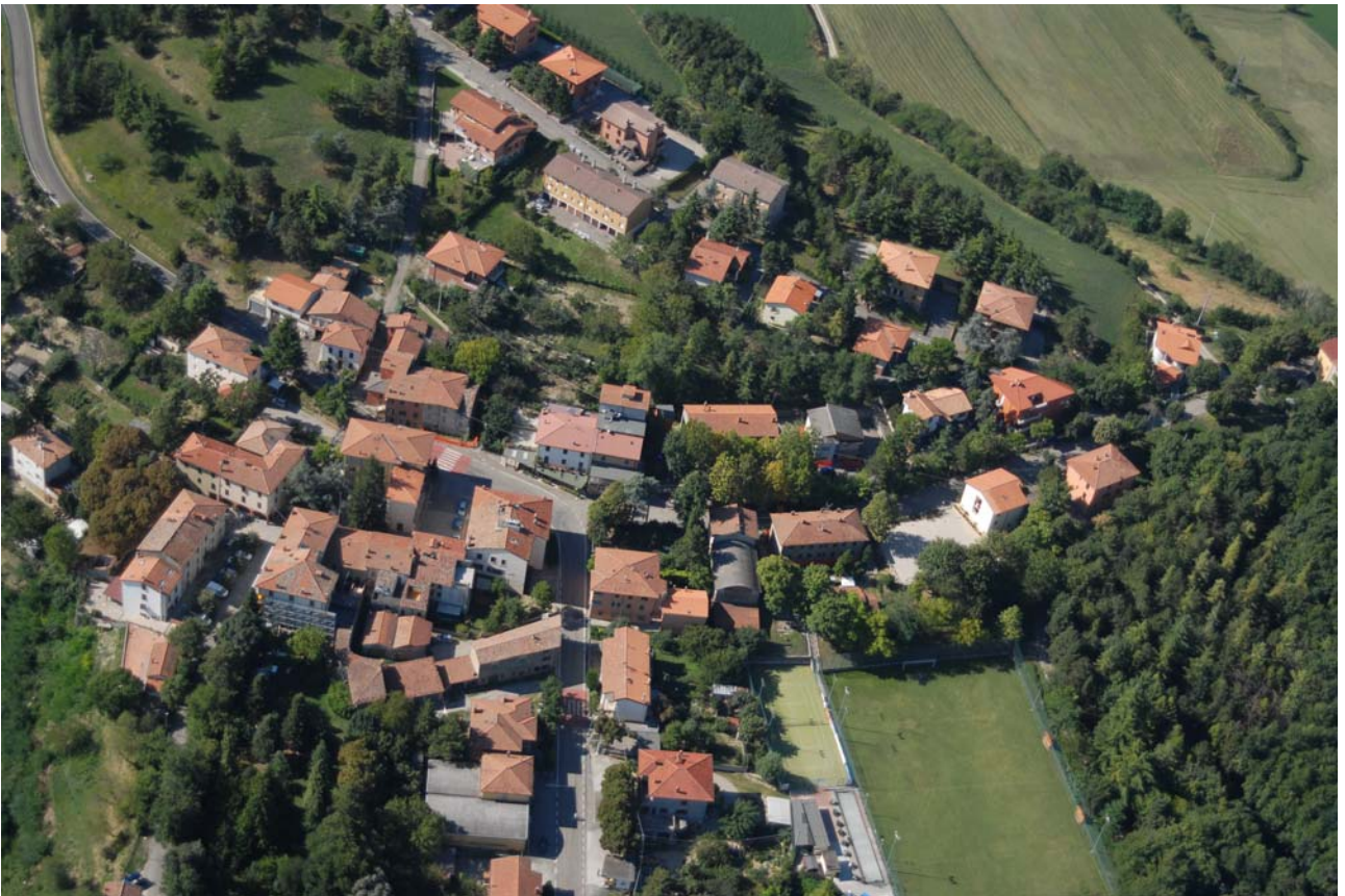
7.15 Il nucleo abitato di Sassoleone mercato