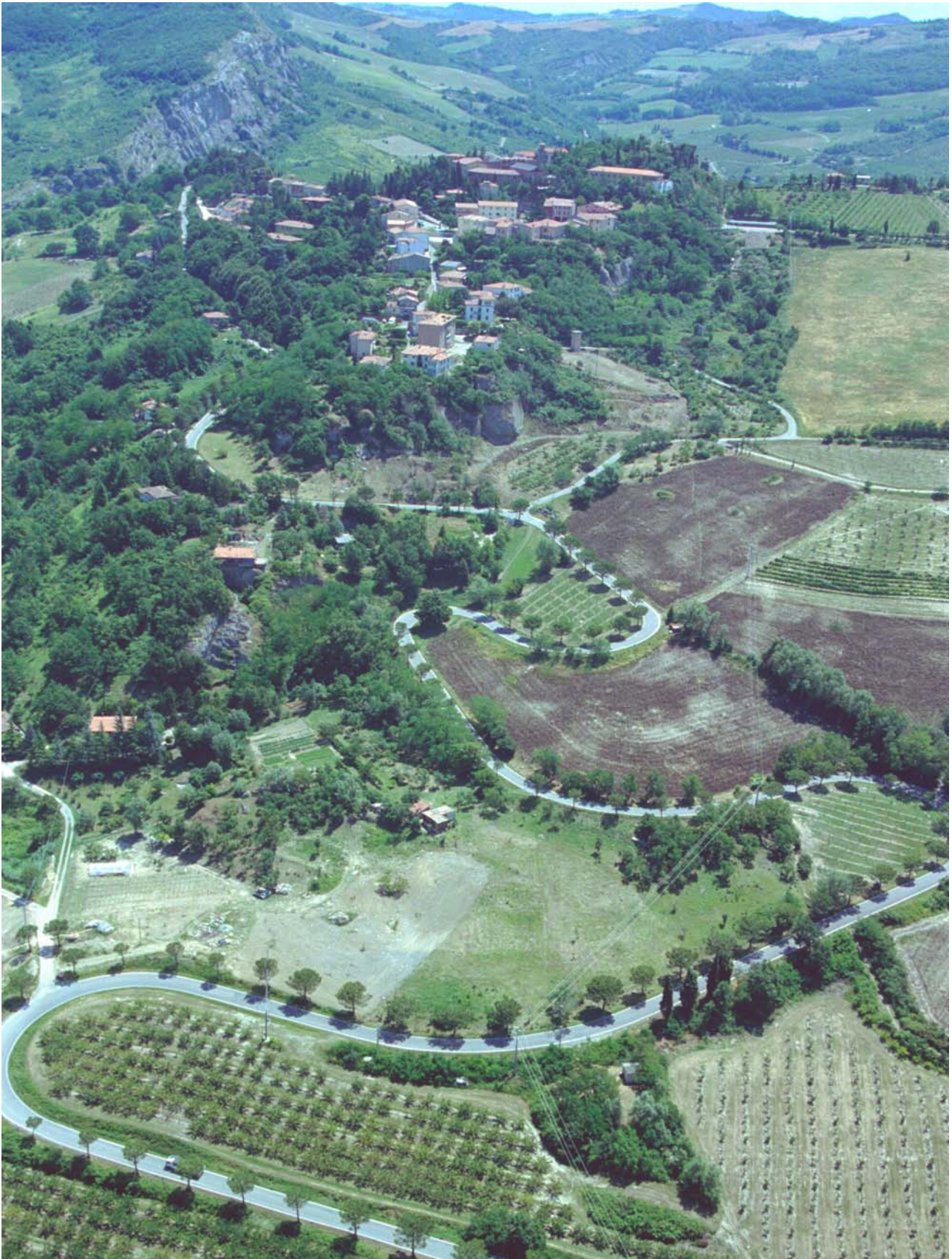
7.13 Il nucleo storico di Tossignano arroccato su uno sperone della Vena del Gesso di cui si intravede l'emergere della stratificazione con orientamento ovest-est in alto a destra (Da Monte Penzola).