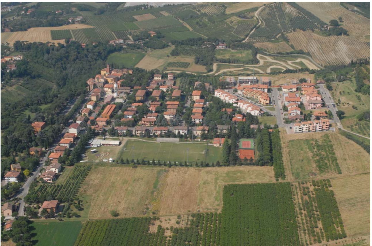
7.21 Il centro abitato di Casalfiumanese