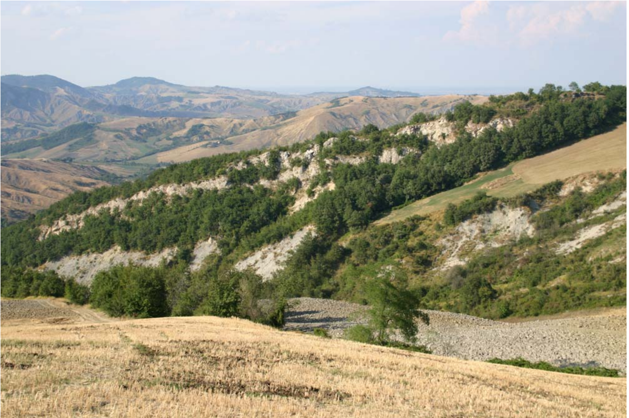
7.14 L'ultima propaggine occidentale della formazione gessoso-solfifera romagnola prima di immergere nelle argille plioceniche in località Gesso.