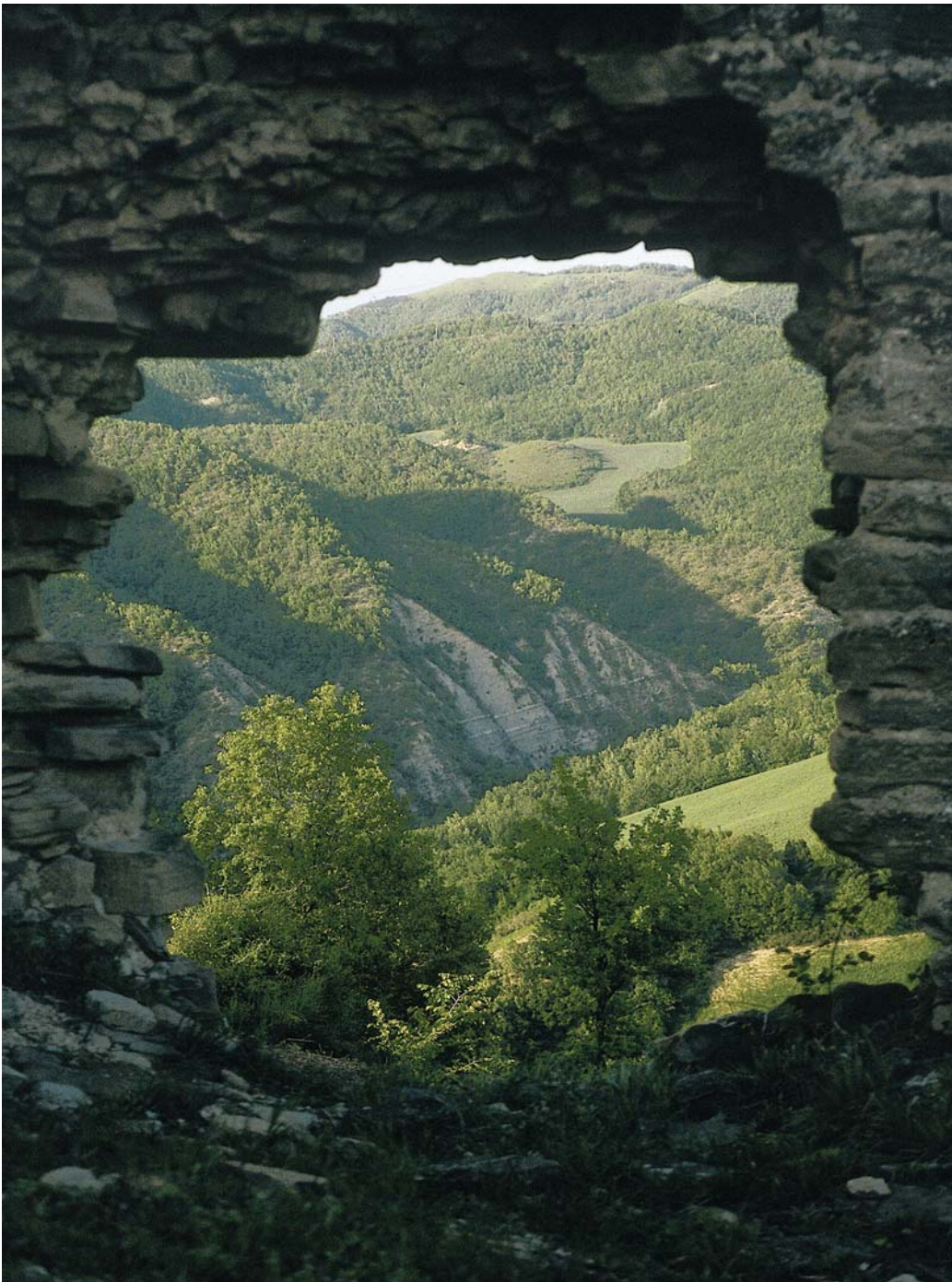
Panorama dal Castello di Cantagallo

Accanto a ciascuna immagine viene riportato un indice numerico che il lettore troverà segnalato sulla carta allegata accanto al simbolo della camera fotografica, simbolo che intende infatti segnalare i punti di vista panoramici.