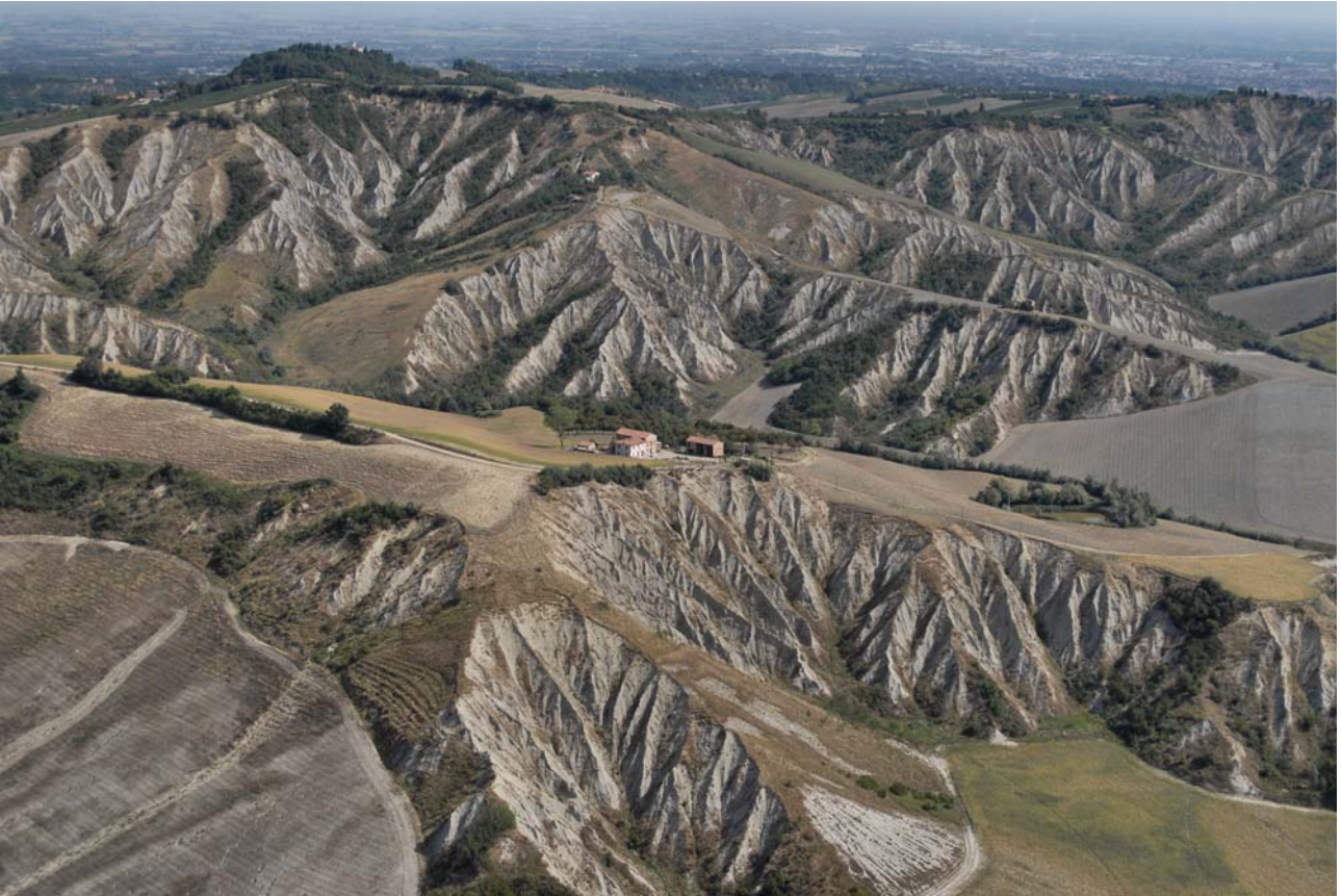
7.18 I calanchi nelle argille azzurre plioceniche nei pressi di Casalfiumanese