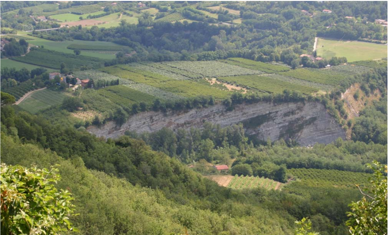
7.6 Terrazzo morfologico e fluviale del fiume Santerno intensamente coltivato nei pressi di Borgo Tossignano (Da Monte Codronco).