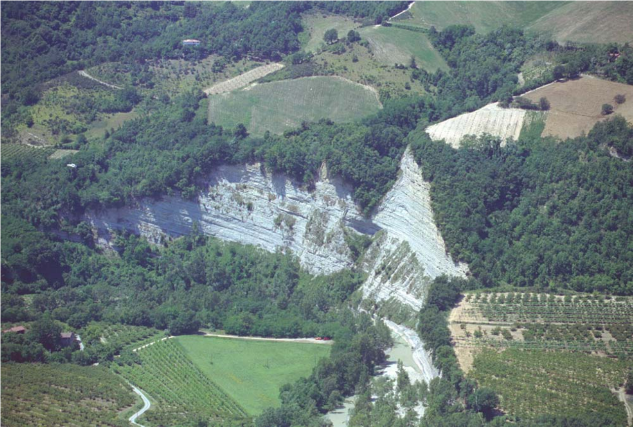
7.5 La "Riva dei Cavalli" sul Santerno; l'azione erosiva delle acque torrentizie connessa a fenomeni di tipo tettonico mettono in evidenza la stratificazione delle arenarie alternate alle marne.