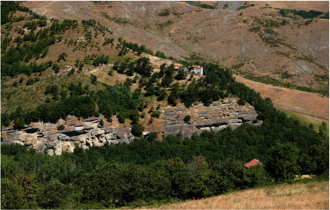
7.7 Dal paesaggio delle "argille scagliose", nella parte alta, a quello della formazione "Marnoso-Arenacea" caratterizzata in questo caso da imponenti banconi di arenaria che scendono a strapiombo sull'alveo del torrente Sillaro (Da Giugnola).